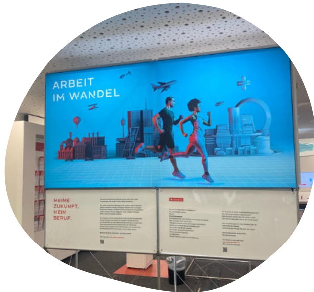
Ausstellung "Arbeit im Wandel"