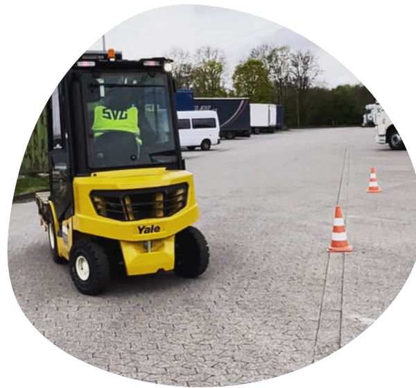
Tag der Logistik